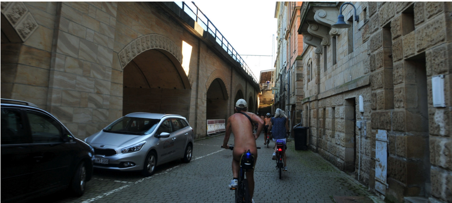
Naturisten-Tage in der sächsischen Schweiz 2017, Sachsen, Deutschland, 7 to 17 August 2017, © Horst Jerina