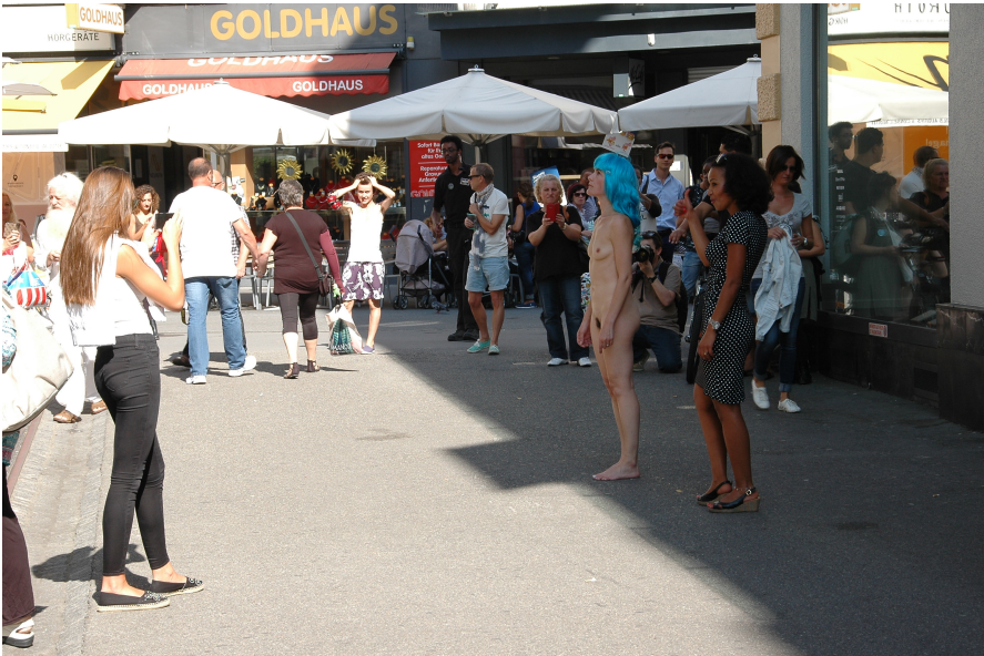
Festival „Body and Freedom – Naked Performances in Urban Space“, Schweiz / Suisse, Biel / Bienne, 2015-08-21..22