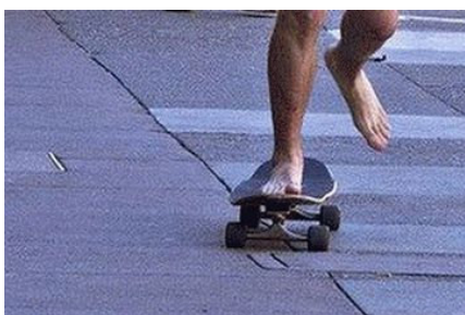
Du kannst nackt Skateboard fahren