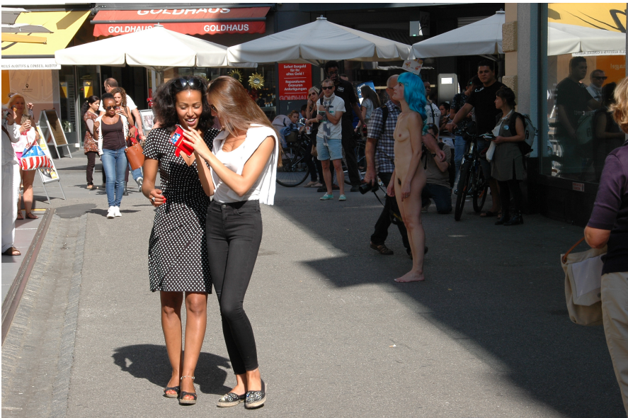
Festival „Body and Freedom – Naked Performances in Urban Space“, Schweiz / Suisse, Biel / Bienne, 2015-08-21..22