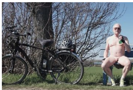
Du kannst nackt Fahrrad fahren