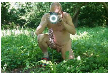
Du kannst dein Foto-Hobby nackt ausüben