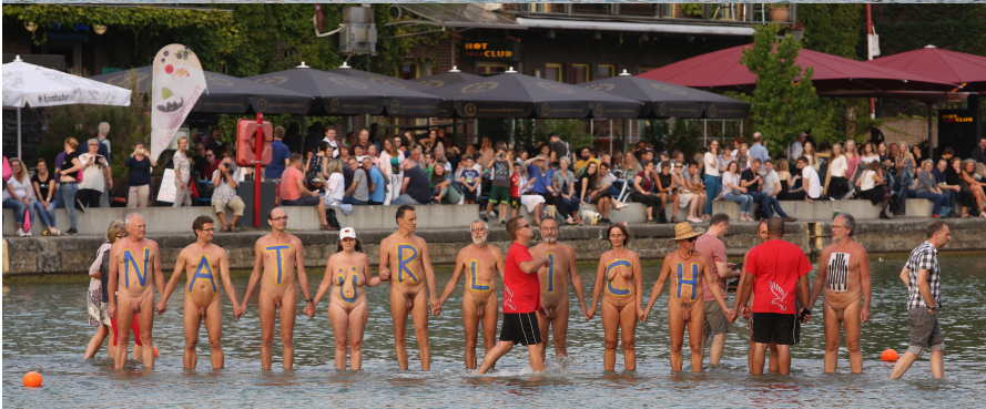
Festival „Skulptur Projekte Münster 2017“: Kunstwerk „On Water“ von Ayşe Erkmen, Berlin und Istanbul, ein BodyArt Performance-Geschenk der „Initiative Aktiver Naturisten (IAN)“, Münster (Westf.), Deutschland, 26. August 2017, © Thomas Kruse