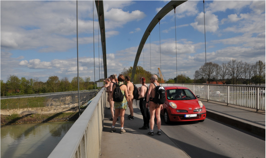
Westfälische Naturisten-Tage (WNT) 2017, Deutschland, 29. April bis 1. Mai 2017