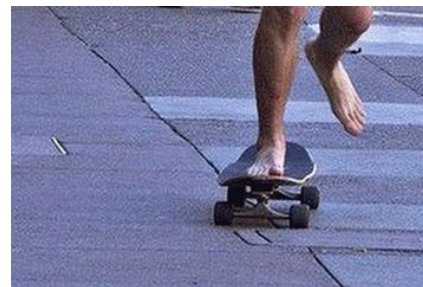
Du kannst nackt Skateboard fahren