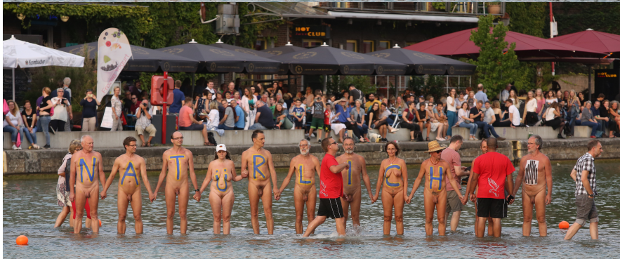
Festival „Skulptur Projekte Münster 2017“: Kunstwerk „On Water“ von Ayşe Erkmen, Berlin und Istanbul, ein BodyArt Performance-Geschenk der „Initiative Aktiver Naturisten (IAN)“, Münster (Westf.), Deutschland, 26. August 2017