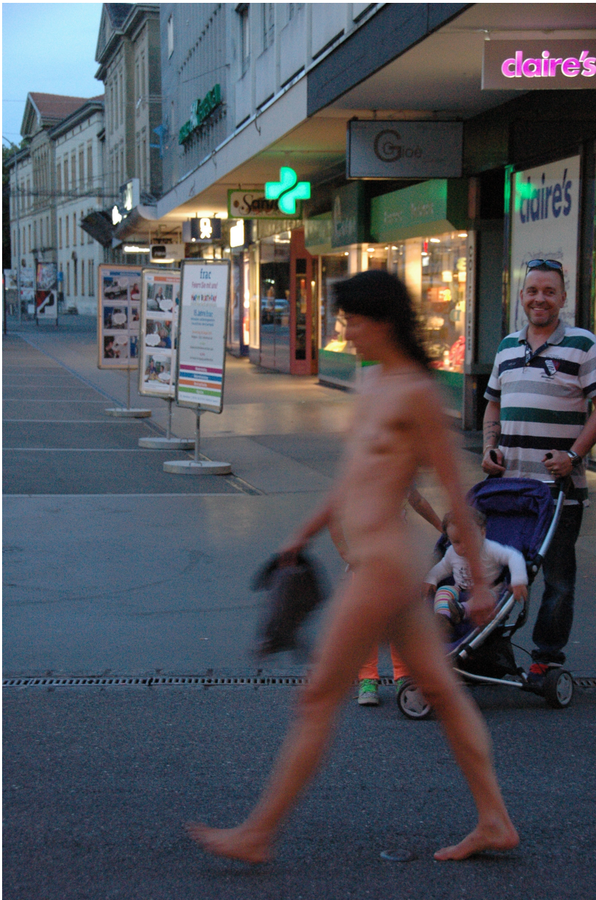
Schweiz / Suisse, Biel / Bienne, 2014, © Horst Jerina