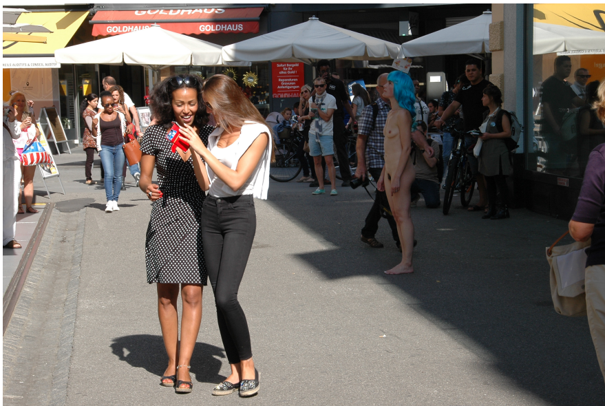
Festival „Body and Freedom – Naked Performances in Urban Space“, Schweiz / Suisse, Biel / Bienne, 2015-08-21..22