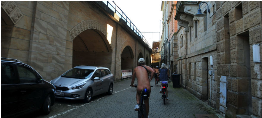
Naturisten-Tage in der sächsischen Schweiz 2017, Sachsen, Deutschland, 7 to 17 August 2017

Eine Übersicht und Einladung zum Weiterlesen