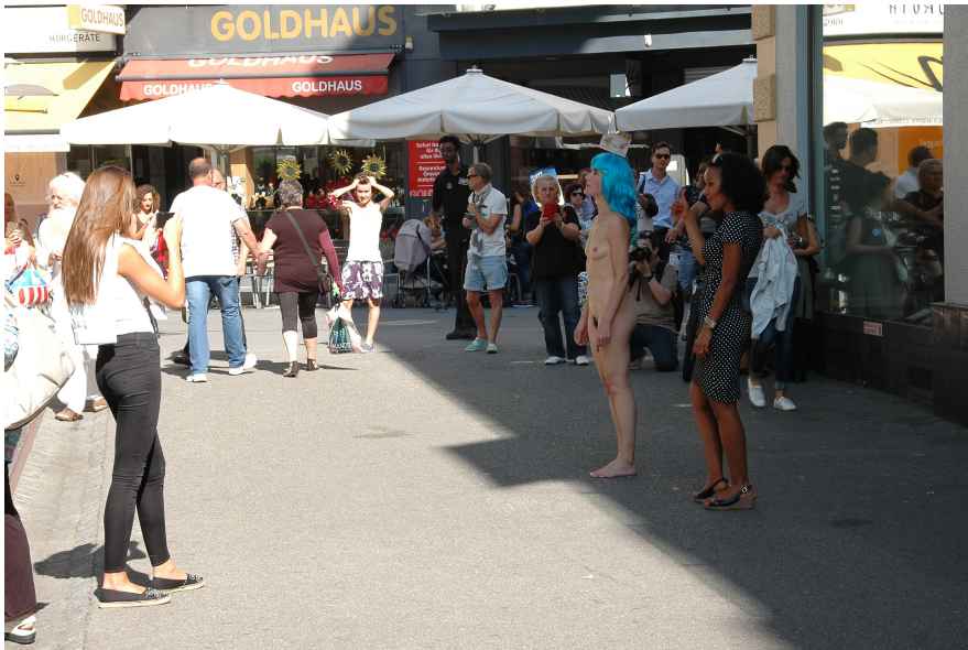
Festival „Body and Freedom – Naked Performances in Urban Space“, Schweiz / Suisse, Biel / Bienne, 2015-08-21..22