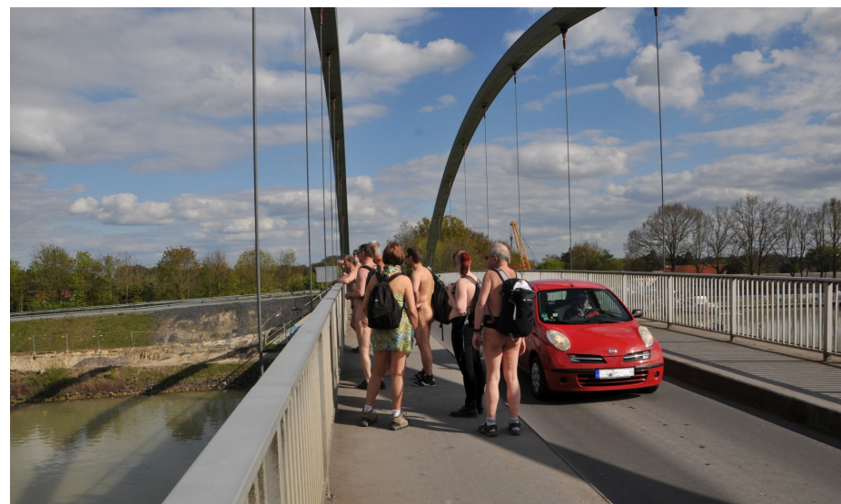
Westfälische Naturisten-Tage (WNT) 2017, Deutschland, 29. April bis 1. Mai 2017, © Horst Jerina

Die Broschüre zitiert Ausschnitte von umfassenden Artikeln im Internet als kurze Antworten auf häufig gestellte Fragen zu unserem natürlichen Lebensstil. Mittels der angegebenen Klick-Hinweise kannst Du die vollständigen Artikel lesen und weitere Artikel und Berichte über natürliches, bloßes Zusammenleben – oft mit Fotos oder Videos – entdecken.