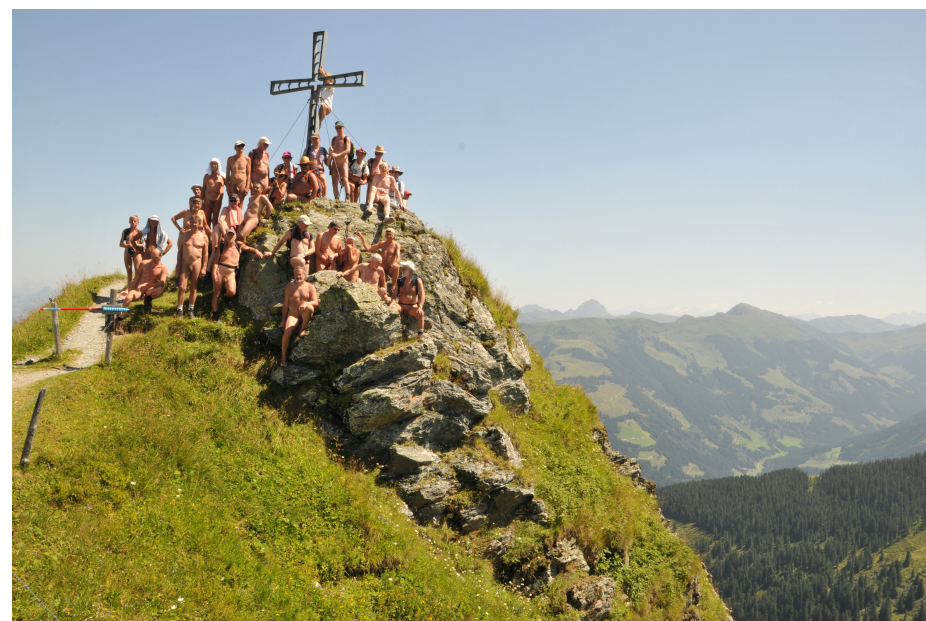
Naked European Walking Tour (NEWT) 2017, Wildschönau-Tal, Tirol, Österreich, 29. Juli bis 5. August 2017, © Horst Jerina