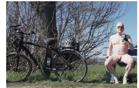
Du kannst nackt Fahrrad fahren