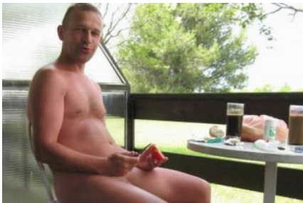
Du kannst natürlich zuhause sein

Fast alles, was Spaß macht – der Phantasie sind keine Grenzen gesetzt. Schau selbst: